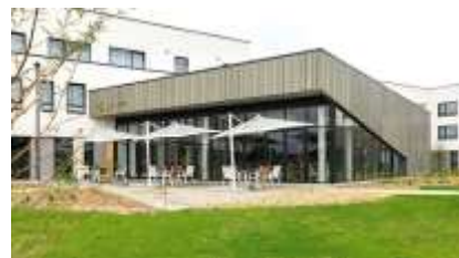
L'équipe de la résidence Les Jardins de l'Aunette