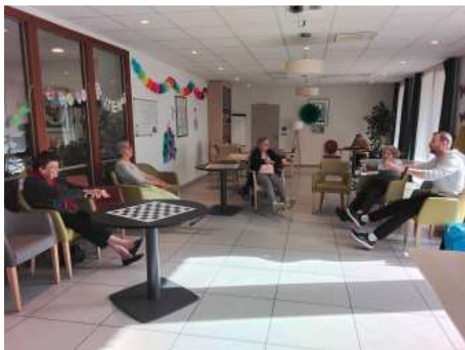
Intervention Ciel Bleu pour la gym douce